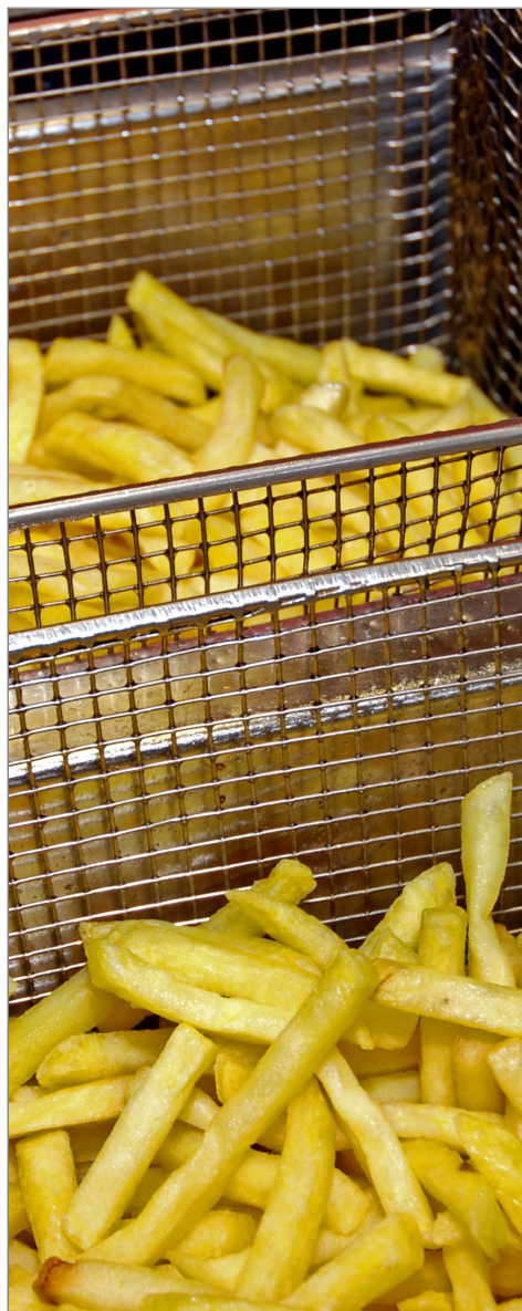
Wie wird das Fett aus der Fritteuse entsorgt?

under „Problemstoffsammelstelle“. Under no circumstances should the grease be poured into the toilet or in a sink. This clogs the pipes.