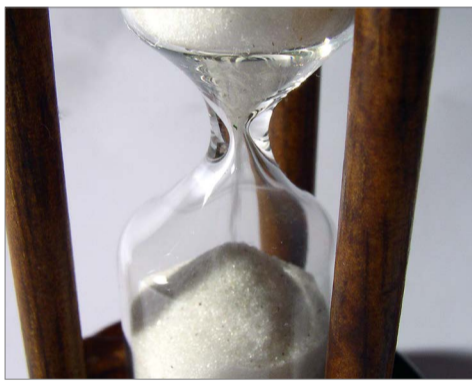
Es dauert lange bis die Berufsabschlüsse anerkannt sind.