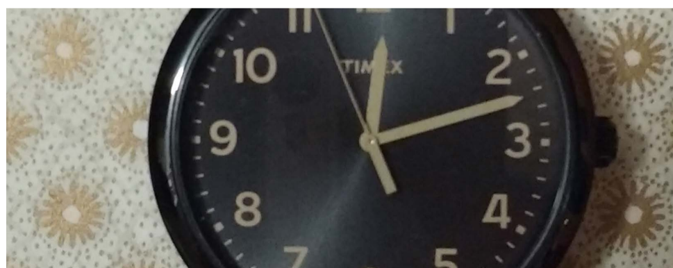
Wenn man zu oft einfach nicht zu einem Termin beim Arzt geht, ohne Bescheid zu sagen, kann es sein, dass man gar keinen Termin mehr bekommt.

absagen. Dafür ruft man in der Arztpraxis an und sagt, dass man nicht kommen kann. Wenn man beim gleichen Arzt zu oft nicht zum Termin erscheint ohne Bescheid zu sagen, kann es passieren, dass man bei diesem Arzt keinen Termin mehr bekommt. Bei Terminen beim Physiotherapeuten zum Beispiel kann es sogar sein, dass man etwas bezahlen muss, wenn man einfach nicht erscheint.