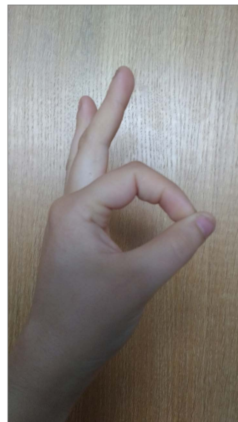
Peace-Zeichen, Peace-Zeichen mit dem Handrücken nach vorne und Kreis mit dem Zeigefinger und Daumen.