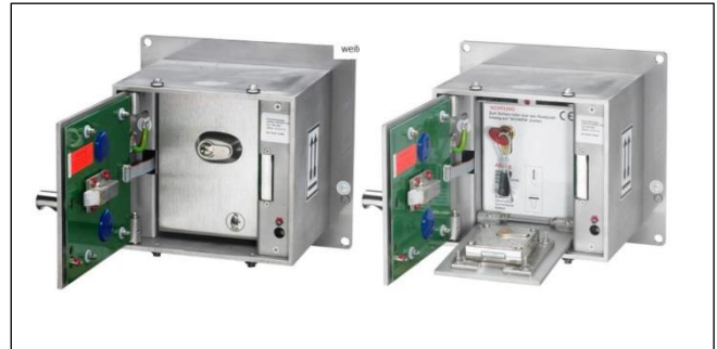
Abb. 4: FSD mit Profilhalbzylinder