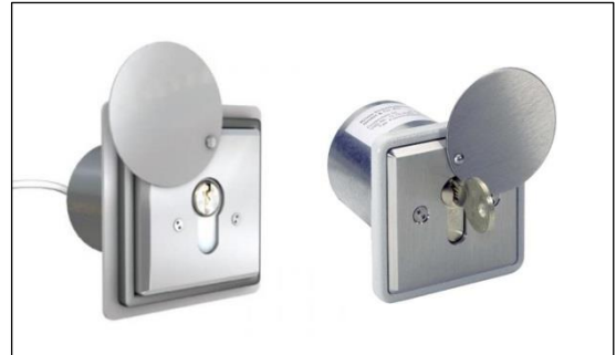
Abb. 2: FSE mit Profilhalbzylinder