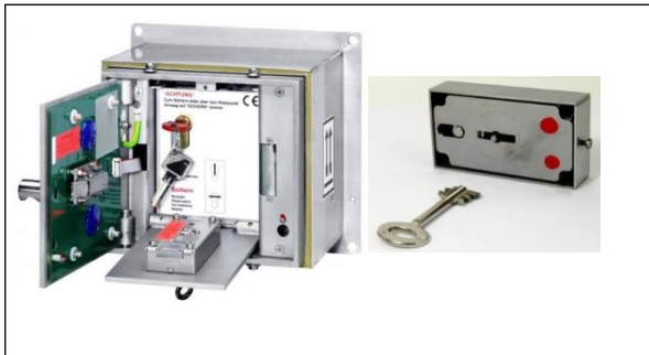
Abb. 3: FSD mit Doppelbart-Umstellschloss