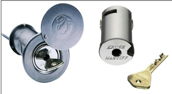
Abb. 1: FSE mit Rundzylinder