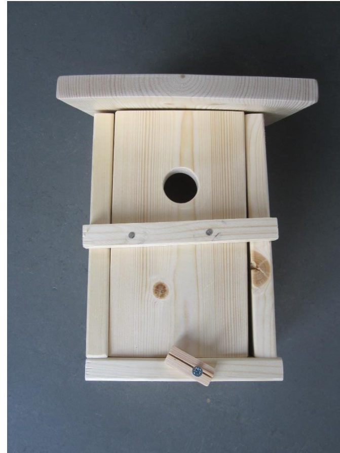
5. Verriegelung befestigen, vorbohren!

Der Bausatz beinhaltet die Bretter für den Vogelkasten. Die Holzeinzelteile sind relativ passgenau. Dennoch ergeben sich hin und wieder Spalten. Diese lassen sich nicht immer vermeiden und sollten als „intergierte Belüftung“ betrachtet werden. Es können Nägel und / oder Schrauben für den Zusammenbau benutzt werden. Mit einer Schraube je Kante erhält der Kasten genügend Festigkeit. Bei Schrauben ist ein Vorbohren ratsam – auf jeden Fall jedoch bei der Verriegelung notwendig.