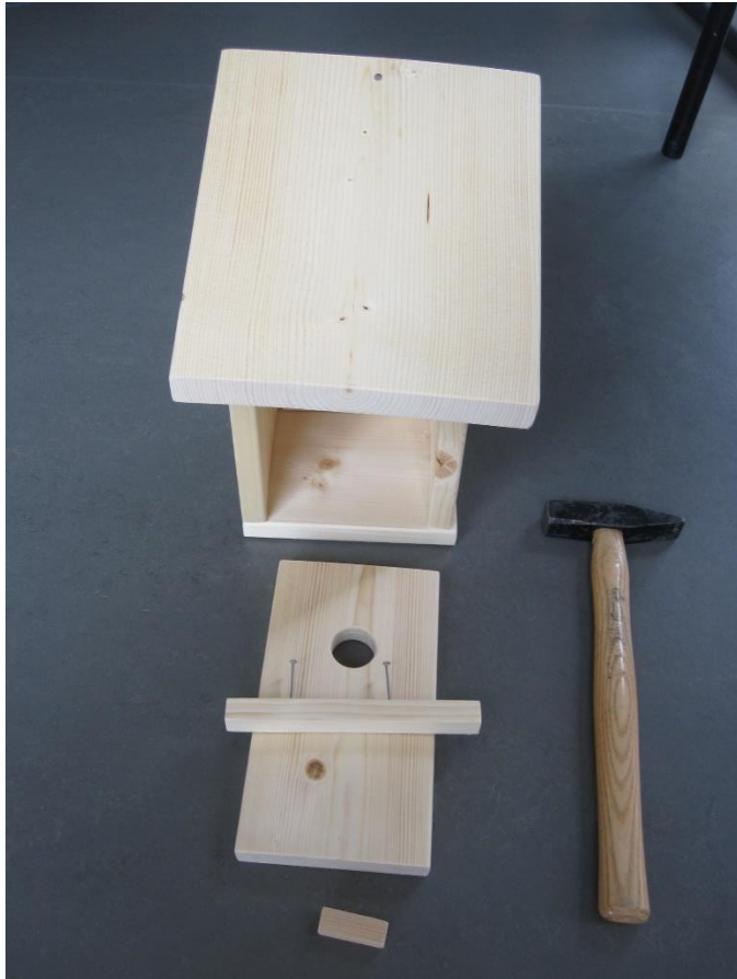
4. Deckel befestigen, am Frontteil Querstrebe befestigen.