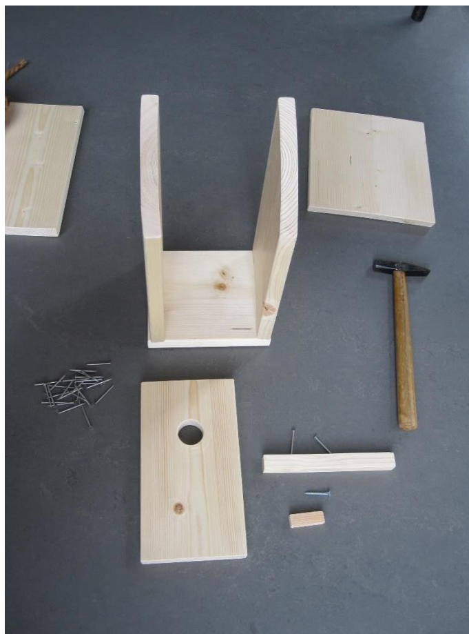
2. Die beiden Seitenteile mit Nägeln am Bodenteil befestigen